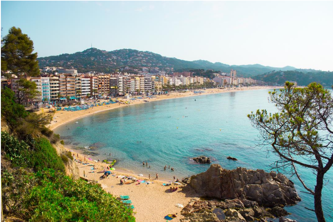
Playa Grande de Lloret de Mar

La prueba de Lloret, los días 6 y 7 de mayo, se disputará en la céntrica Playa Grande, que hace más de un quilómetro y medio de largada. Toda la información del campeonato se puede obtener a través de este enlace http://bit.ly/VichyCatalan2017 y para las inscripciones habrá que estar atento, tanto para el Vichy Catalan Volei Tour como para el Open FCVb, a la página http://voleiplatja.fcvolei.cat/ .